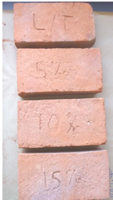
Figura 1. Fotografía que muestra algunos ladrillos sinterizados.

Se fabricaron exitosamente ladrillos para construcción (sin grietas o fracturas que los inutilizaran), reemplazando parcialmente la mezcla tradicional del ladrillo (arcilla, aserrín, estiércol y agua) con 5, 10 y 15 % en peso de vidrio reciclado y pulverizado; la Figura 1 muestra algunas piezas terminadas. Todas las piezas fabricadas presentaron coloración rojiza, dicha coloración es producida por las impurezas contenidas en la arcilla, pero principalmente por el óxido de hierro presente [9] .